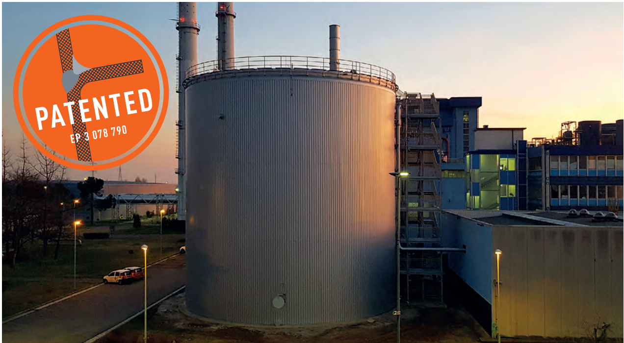
LIPP Großpufferspeicher geschweißt mit 4.900 m 3 zur Wärmespeicherung eines Kraftwerkes