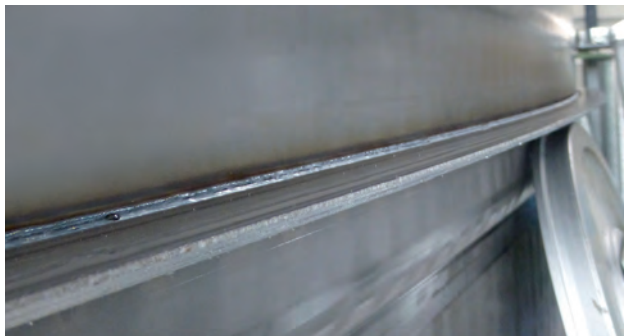
LIPP Stahlbehälter mit speziellem, umlaufenden Profil

PRODUKTINFO //////////////////////////////////////