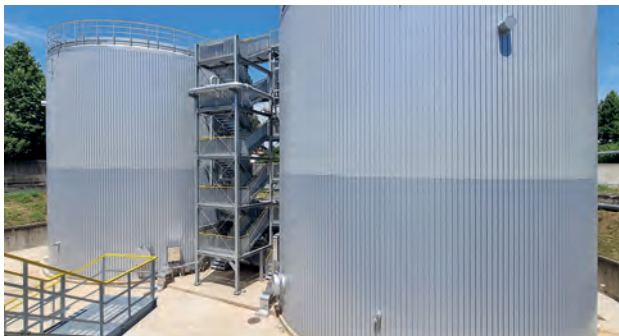
Zwei LIPP geschweißte Großpufferspeicher mit je 2.100 m 3

Die LIPP Lagertanks können in kürzester Zeit vor Ort im Freien oder im Gebäude gefertigt werden. Das spezielle umlaufende Profil sorgt dabei für zusätzliche Stabilität im Vergleich zu herkömmlichen Verfahren.